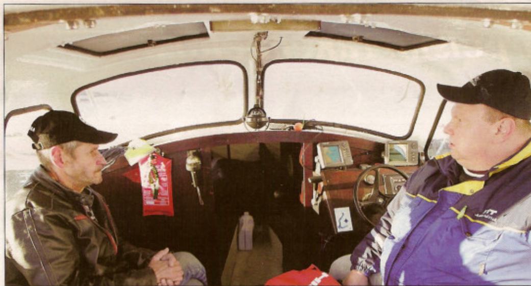
Uisteluveineessä on välttämättömät karttaplotteri ja kaikuluotain. Myös kompassit ovat pakolliset varmuusvälineet merellä liikuttaessa. Kalakaveri Erkki Ikonen (vas.) ja Jukka Häyhä ohjaamossa.

Fiskari on valmistunut 1980 ja niitä on tehty tiettävästi vain 21